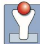
La Nuova Speranza