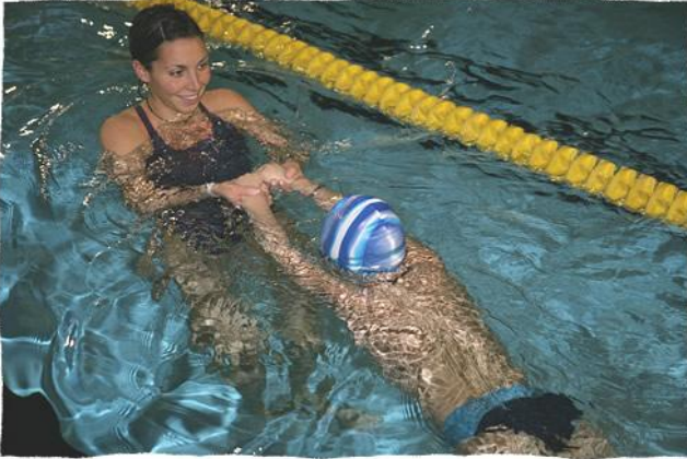
corsi di acquaticità

non sono sottoposti ad obbligo di certificazione medica, per l'esercizio dell'attività sportiva in età prescolare, i bambini di età fino a 6 anni , fatta eccezione dei casi specifici indicati dal pediatra