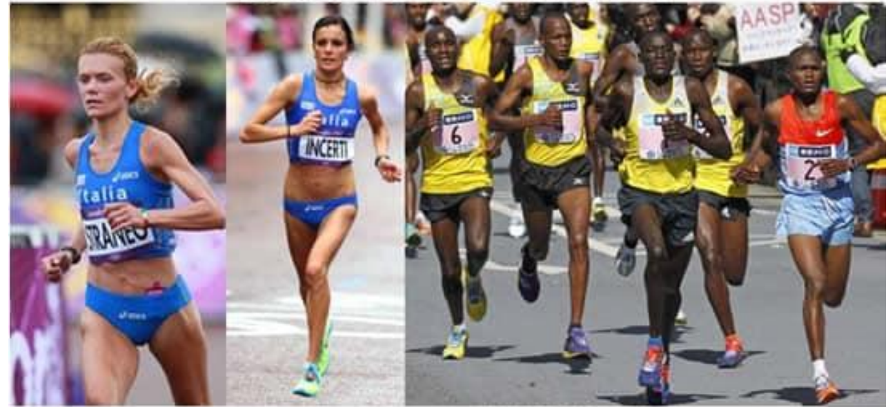
LAVORO = ATTIVITA' ANAEROBICA