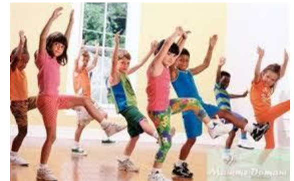
Esercizi di dinamismo